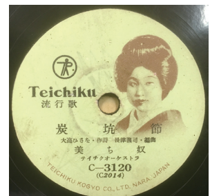
図10 美ち奴の「炭坑節」

民謡を表看板としながら流行歌としてレコード産業の重要な商品となった「炭坑節」は、何々行進曲や何々音