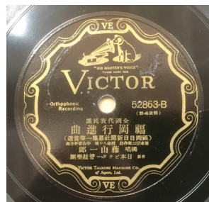
図8 「福岡行進曲」ラベル

「福岡行進曲」は、歌詞一番で玄海灘・日和山・長浜を歌った後、「博多節」に歌われた伝統的な物産の博多帯・