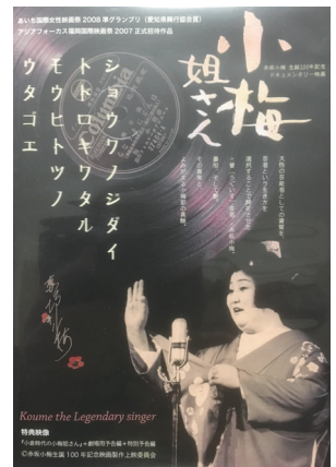
図2 記録映画 DVD『小梅姐さん』（2007）